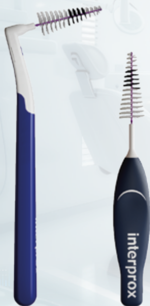
Super Conical Plus PHD 2.0